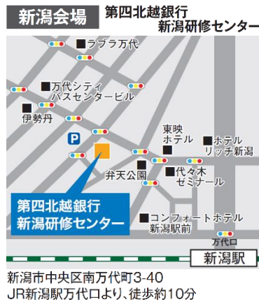
新潟会場 第四北越銀行 新潟研修センター 新潟市中央区南万代町3-40 JR新潟駅万代口より、徒歩約10分

お車でお越しの場合は周辺の有料駐車場をご利用いただき、料金は各自でご負担いただきますよう、お願いいたします。