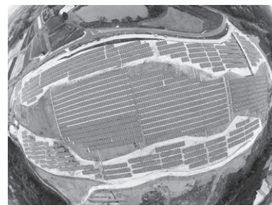
▲同社のソーラー発電施設。100年企業を目指し事業を展開していく

“石油製品、金属製品の販売を通じて、社会・お客様・社員の三位一体の幸福と発展を目指す”という社是のもと、同社は100年企業を目指して歩んでいく。