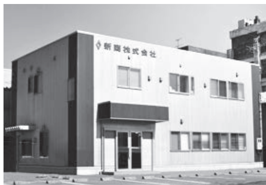
▲平成16年に現在地へ移転した本社外観

今年、創業80年を迎える同社は、工業用オイルなどの石油製品と金属加工製品の販売を2本柱に、オートガス事業やコインパーキングの運営、車販売、太陽光発電事業などを手広く手掛けるまでに成長した。