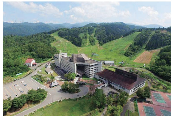
▲広大な施設をもつ一大リゾート

日本全国および海外から訪れる多くのお客さまのため、創意工夫を重ねており、今では年間利用者が15万人にも及んでいる。