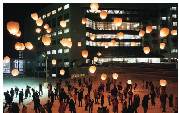
▲幻想的な冬のイベントスカイランタン

世代を超えて愛される同施設は、多くの笑顔が溢れている。笑顔の思い出をより多くのお客さまに届けるため、同社の挑戦は続いていく。