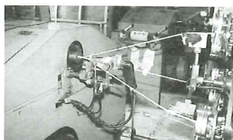
▲3本よりを溶着加工する