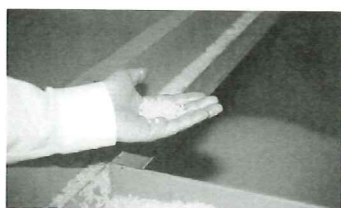
▲200度の高温で原料の粒状ポリプロピレンを溶解する

平成14年春に完成した新工場では、機械設備の配置換えなど、より効率的な生産体制を確立。主力商品のPPテープ・ロープ、レコード(P, E)巻は、原材料の溶解から仕上がりまで、一括ラインで製造。工場内には人員はほとんど必要なく、機械を管理する人が数人いるのみ。今後は、一層のコストダウン、機械稼働率アップを行い、さらなる生産性の向上を目指す。また、中国からの一部商品輸入も視野に入れ、品揃えの多様化にも努める。