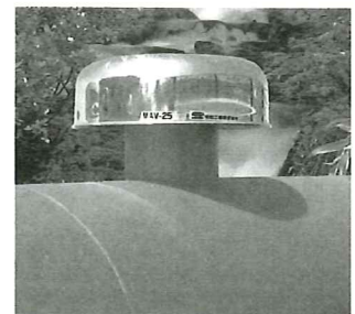
▲水道管の管路に入った空気を抜く空気弁「エアリス」。寒冷地でも凍りにくく、耐久性にも優れた明和工業の特許製品。

明和工業では、現地の環境に合わせてオーダーメイドで水管橋や橋梁添架の設計、パイプの製作、施工を行う。また、特許製品の空気弁「エアリス」など関連金属製品や緊急用貯水槽等も製造する。