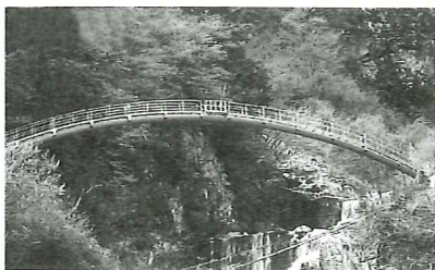
▲オーダーメイド水管橋