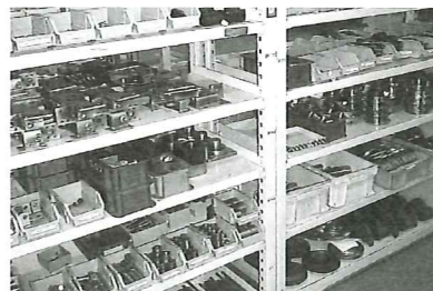
▲部品構成300点に及ぶ 機械装置のサブアッセンブリ品

さらに、同社では、今年3月から成果主義人事制度を導入。従業員に自主目標を与え、評価も明確にすることで、やる気のある従業員の士気を高めている。