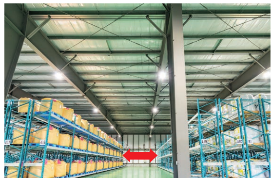
▲ラック自体が左右に移動し、フォークリフトの通路を確保

同設備の導入により、積み下ろしの作業時間と在庫管理の省力化・効率化が実現でき、倉庫の収納量も固定ラックに比べ約2倍に拡大している。