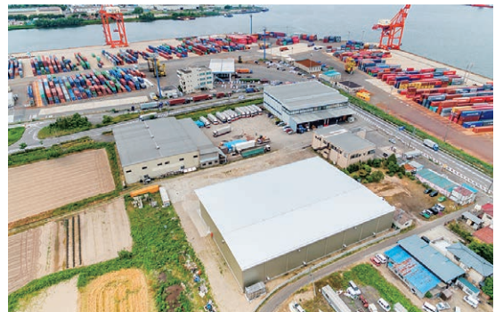
▲敷地面積約5,000坪の同社全景（ドローンによる空撮）

新潟東港工業地帯に位置し、同港から輸出入される塗料や工業製品の原材料の保管・梱包・輸送をワンストップで提供するとともに、高い梱包技術により顧客の信頼を得ることで業績を拡大。現在では、同エリア有数の総合物流会社に成長している。