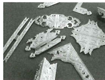
▲仏壇金具。金型から鍍金まで自社工場で一貫生産

同社は昭和30年に創業し、仏壇をはじめ、神社や仏閣、御輿等の金具を製造している。顧客の要望に対してきめ細かく、かつ柔軟に対応できるように、自社工場で金型からプレス、鍍金まで一貫生産できる設備を完備。また、高い技術力も評価されており、現在では国内シェア約70%と、業界トップの地位を確立している。