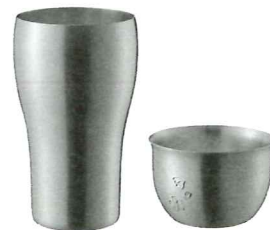
▲銅製のタンブラーとぐいのみ。熱伝導に優れ、冷たいお酒を注ぐと一気に冷え、冷たさを保持する

同社では、今後こうしたハウスウェア関連商品を、仏壇金具とともに収益の柱とするべく、主力商品であるトング等の増産に向けた設備を増強。また、銅製のタンブラーやぐいのみなどを新商品として開発し、新たな販路を開拓する。