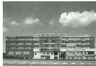
④健康の駅ながおか (福祉施設)