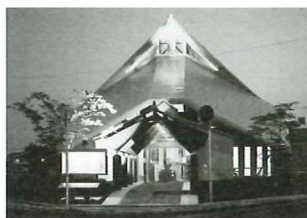
①ゆきんこペンギン (教会)