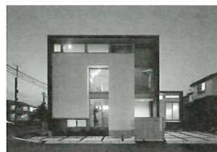
②ファサモンド (住宅)