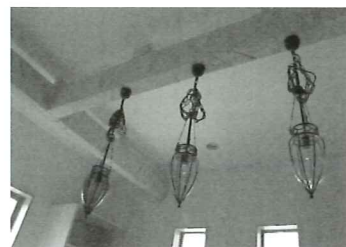
▲南欧モダンの部屋(ミーティングルーム)