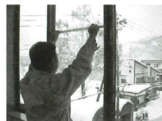
▲内側から施工が可能