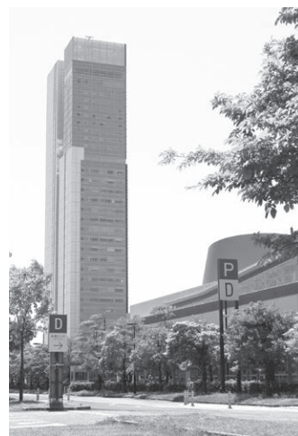
▲当社の事務所のある万代島ビル

最近では、当社が取り組む新しいコンテンツビジネスへの提案に、将来的な発展性が期待されており、多くの注目が集まっている。