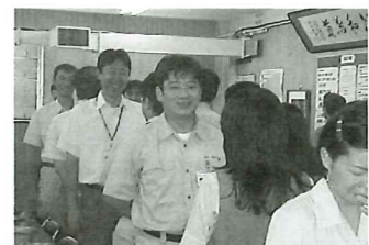
◀「笑顔で仕事を」経営協議会