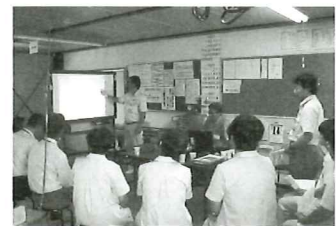
◀災害ゼロを目指すKYKミーティング

また、月に1回全員参加で行われる経営協議会では、毎回、笑顔の練習から始まる。「こういう時代だからこそ笑顔が大切。ニコニコ進んで仕事するか、いやいやするかでは仕事の出来栄が大きく違います。どんな仕事に対しても『私がやります』と積極的に手をあげることで、前向きになり、良い仕事ができるのです」と社長は言う。