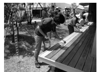
▲展示場でのイベントの様子

また、新潟市西区にある展示場「ピュアカーサ」ではガーデンカフェスペースを併設し、料理教室やランチサービスも定期的で開催。今後も、家と暮らしに関する知識や役に立つ情報を数多くのお客さまにお届けしていく。