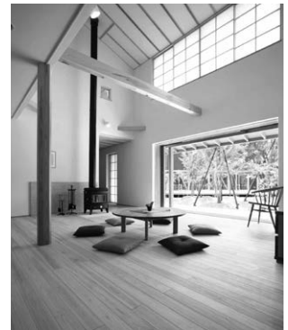
▲国産の木をふんだんに使用した心地よい空間

現在は、新潟市に2カ所と長岡市に1カ所の展示場を開設し、住む人の健康を考えた良品質な住宅を年間約60棟手がけている。また、グループ会社「(株)ナレッジライフ再生良家」を設立して、リフォームや既存住宅の大規模な改修を行うリノベーション、中古住宅の販売などの事業を展開している。