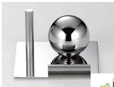
▲大手企業のキャンペーンに採用された 「プリマリオ スマートフォンスタンド」

機能面での差別化が困難になる中、デザインが持つ付加価値の意味は大きい。同社は新しい才能と個性を生かし、生活に潤いと利便性を届ける製品作りに努めて行く。