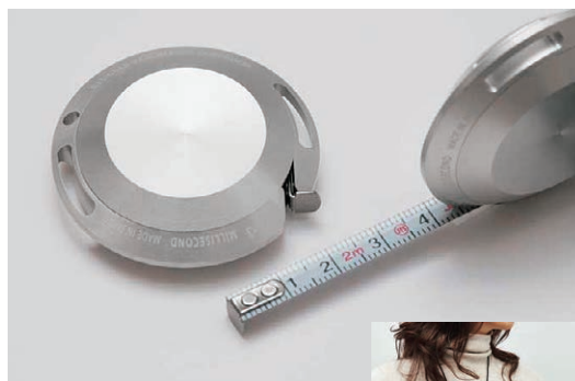
▲「ミリセカンド アルミメジャー」 様々なスタイルの身につけ方が可能