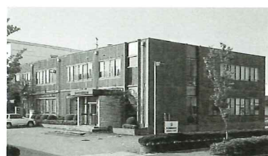
▲新潟市西区流通センターにある同社

同社の強みは、日本を代表する大手メーカーと直結した「安定した商品供給力と幅広い情報力、提案力」である。中でも、砂糖の供給量は県内トップクラスを誇る。また、営業エリアも新潟県内のみならず、東北、北陸、関東地方など東日本を中心に広範囲で展開している。