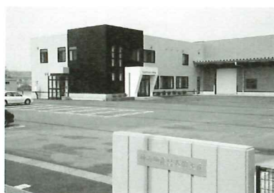
▲平成24年3月に移転新築した長岡支店

一方、収穫された農作物は、農産物検査員の資格を持つ担当者が厳正な検査を行い、販売先へ提供する。こうした取り組みが、生産者や販売先との信頼関係を築き、ネットワークが広がっている。