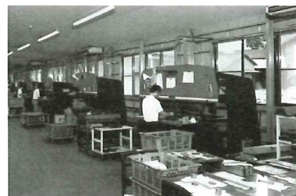
▲ベンダーによる折曲作業。 技術水準はトップレベル