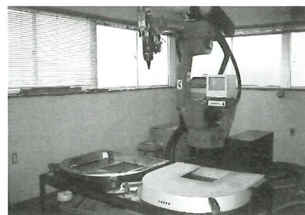
▲YAGレーザー溶接により美しい仕上がり とコストダウンを実現