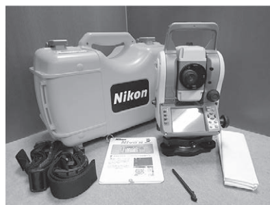
▲ニコン特約店として様々な機器を提供