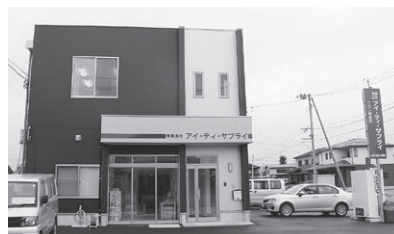
▲移転新築した新社屋

競合先が限られる測量関連に業務を特化し、安定成長を果たしてきた同社。しかし、最近は主要顧客の建設業界で厳しい環境が続き、新たな対応方針が必要となっている。こうした中、同社では今後は、人材育成に加えて、効率化を可能とする新技術やITの活用により、顧客からの複数のニーズに自社で対応できる総合サービスを提供し、顧客満足の維持向上と事業の発展を目指す方針である。