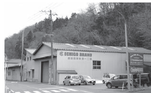
本社を、工場の近隣に、移転新築の予定