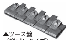
▲ツース盤(縦ピンタイプ)