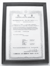
▲工場認定制度の認定書