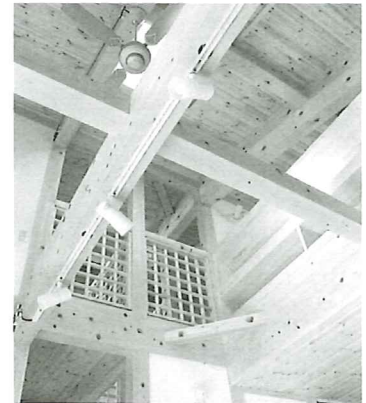
▲梁や柱に東濃檜を使用