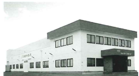
▲(株)シー・エス・シー本社・工場(新潟市東区)

同社の製品は、新潟県はもとより東北一円、関東、関西方面の火力・原子力発電所や石油化学プラントなど極高温・低温となる設備ユーザーから大変好評を得ている。