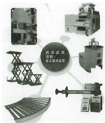
▲綿密な鋳造を円滑に行うラインシステムまでコーディネートする

また新事業開始と同時に、5S（整理・整頓・清潔・清掃・躰）活動を実施。5Sを単なる職場の美化運動ではなく、人材育成・資質向上の柱とした重要な活動として、五十嵐社長を先頭に社員一丸となって取り組んでいる。特に、毎週のトイレ清掃は、お客さまの課題に敏感となり、目配り・気配りが向上したと、5S効果を感じている。