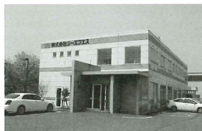
▲新潟市の新潟東港工業団地内にある本社

同社は、平成11年4月、鋳造プラント設備のトップメーカーである新東工業(株)（本社・名古屋市）の新潟地区代理店として創業。以来、自動車や鉄道など様々な分野で用いられる鋳物部品を製造するための鋳造機械販売を軸に、着実に業績を伸ばしてきた。同社では、機械販売が順調な中、収益の柱となる新たな事業戦略を模索していたが、平成20年秋のリーマンショックを契機に、「営業とサービスが一体（2人体制）となったソリューション営業とメンテナンス部門強化」戦略を打ち出し、新たな顧客獲得に取り組んでいる。